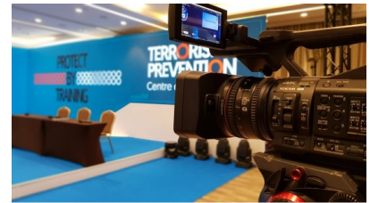
Konferencja "Protect By Training"