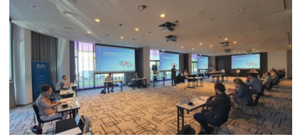
Szkolenia z zakresu prewencji terrorystycznej

W kwietniu minęły 3 lata od powołania Centrum Prewencji Terrorystycznej ABW. W tym okresie rozpoczęliśmy i realizowaliśmy projekty, m.in. w dziedzinie szkoleniowej. Opracowaliśmy program i łącznie przeszkoliliśmy około 6000 urzędników i funkcjonariuszy z zakresu prewencji terrorystycznej, z czego ponad 2000 w ramach projektu PO WER. Z kolei na zaproszenie instytucji administracji państwowej funkcjonariusze CPT ABW przeszkolili około 4000 osób. Zrealizowaliśmy również ogólnopolską kampanię 4U! oraz wiele innych zadań, o których