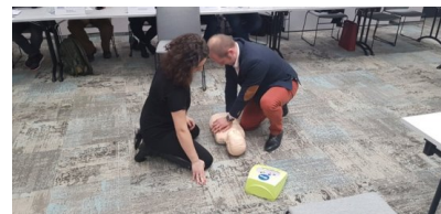
Szkolenia w ramach projektu PO WER