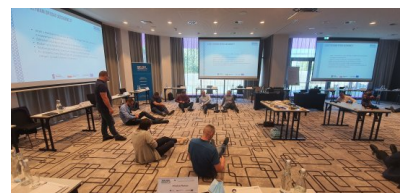
Szkolenia w ramach projektu PO WER