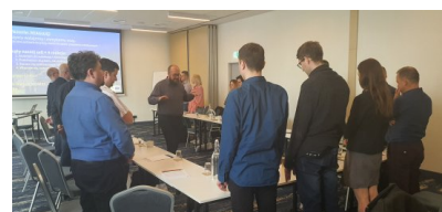
Szkolenia w ramach projektu PO WER