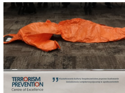
Szkolenia w ramach projektu PO WER