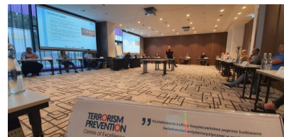
Szkolenia w ramach projektu PO WER

Projekt „Podnoszenie kompetencji służb bezpieczeństwa państwa, pracowników administracji