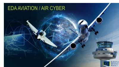
Warsztaty w ramach projektu asymetrycznego