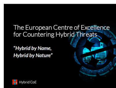
Warsztaty w ramach projektu asymetrycznego