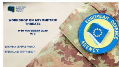
Warsztaty w ramach projektu asymetrycznego